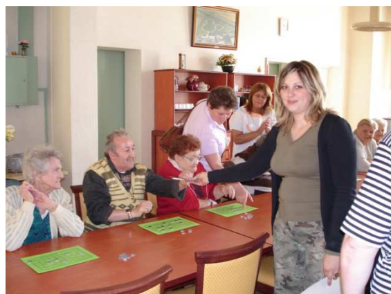
Les nombreux participants