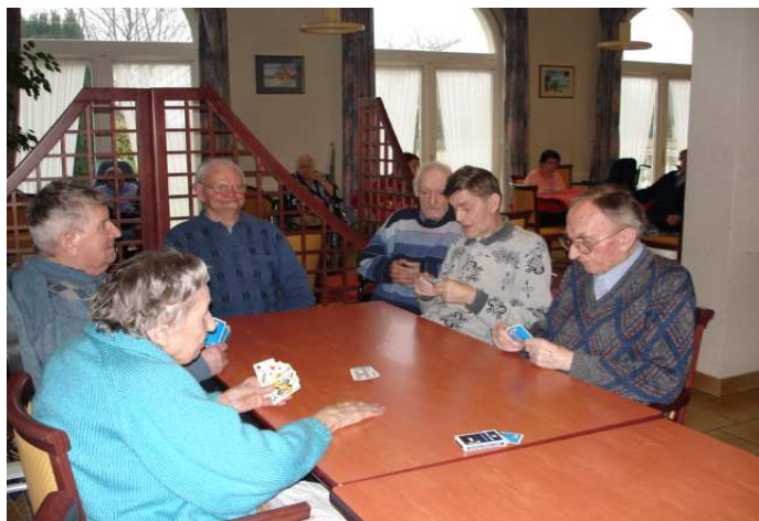
Alors ! Tu coupes ?

Pendant le 1er trimestre, les résidents avaient rendez-vous dans la salle à manger pour jouer à divers jeux de société tels que belote, dominos, petits chevaux, etc. Ces après-midi conviviaux permettent de rompre l'isolement et de mieux se connaître.