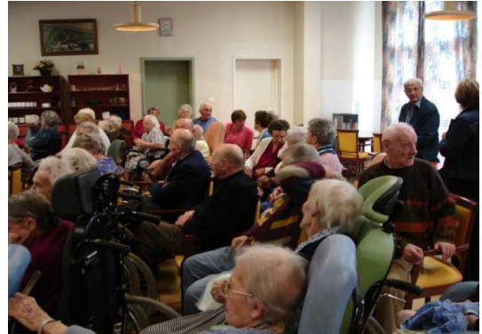
Pendant la représentation