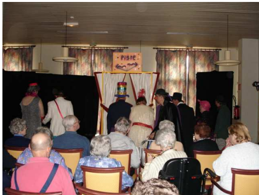
Les comédiens côté « pile »