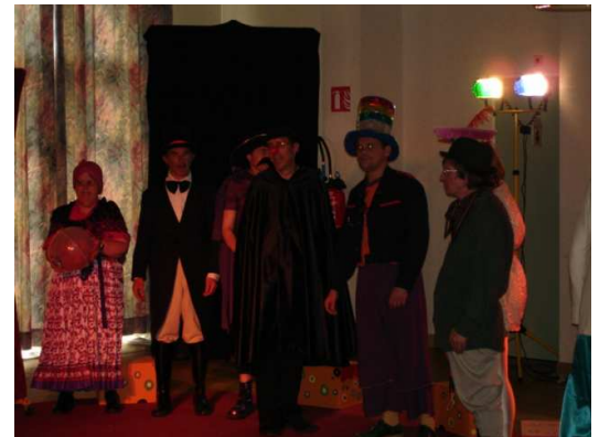
Les comédiens côté « face »