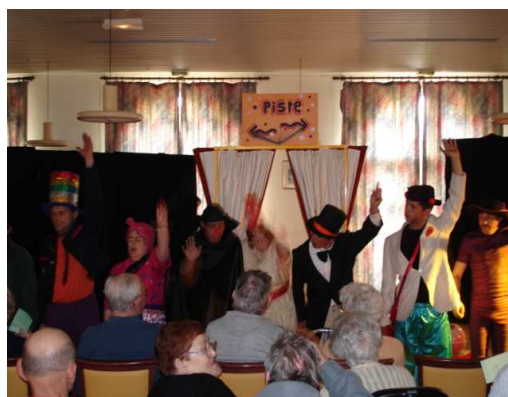
Le dernier salut des comédiens