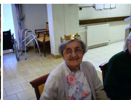
Un roi et deux reines