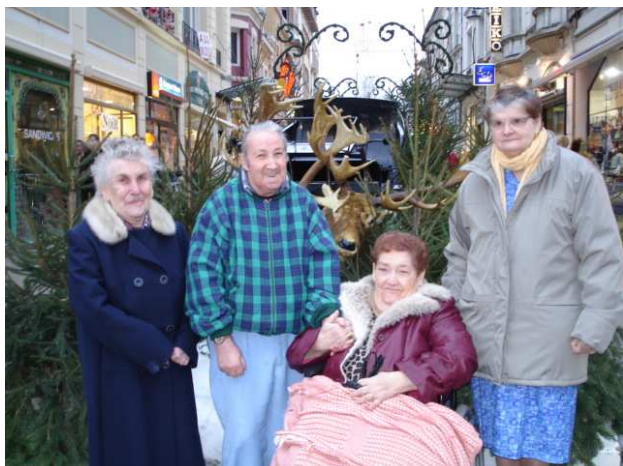
En compagnie des résidents du CHG