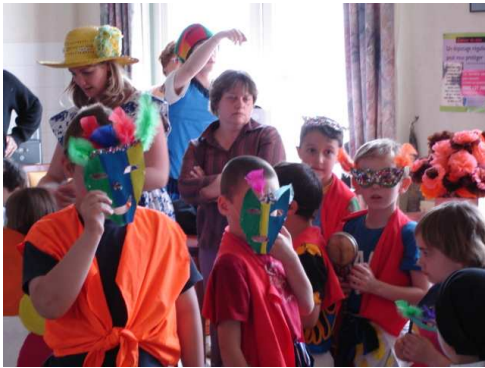
<= Les acteurs =>