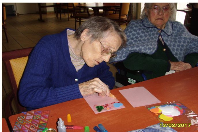
C'est un travail minutieux !

Bref, tout pour entretenir l'agilité des mains et des doigts.