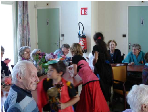
La remise des fleurs