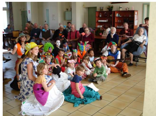
Le rayonnement des visages