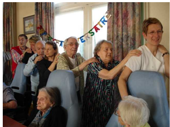
La bonne humeur