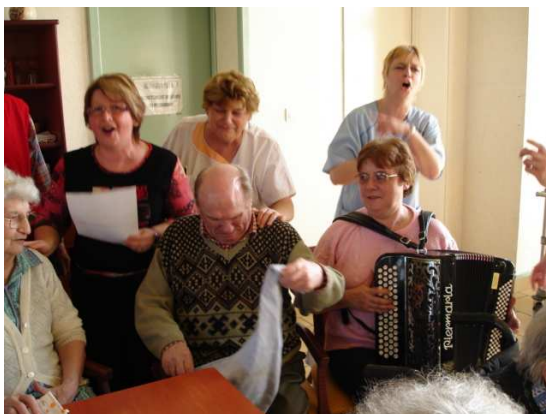
Emotion trop forte