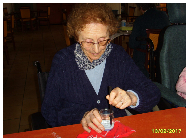
La peinture à l'eau c'est plus rigolo !