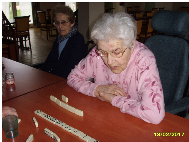
Je joue lequel ?