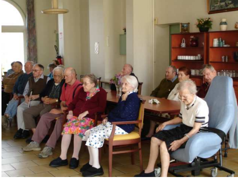
<= Les spectateurs =>

Le 20 avril, les enfants du centre aéré de MOY sont venus présenter leur spectacle. Quelle bonne initiative des responsables du centre. Beaucoup de joie, de rires et d'émotion pour ce bel après-midi.