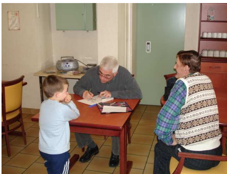
L'artiste et un modèle

Le goûter fut aussi à croquer puisque des croque monsieur furent servis aux résidents.