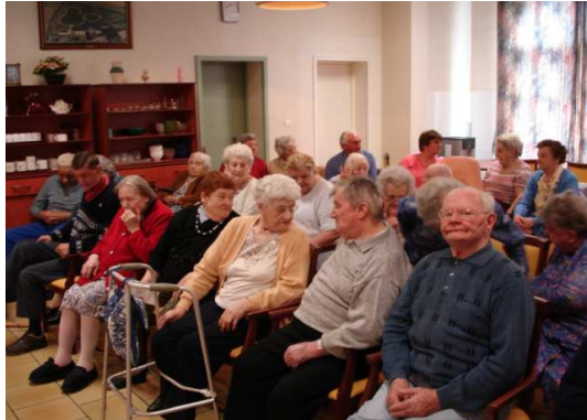
Avant les trois coups

Un goûter avec les comédiens et les membres du club a clôturé cette sympathique manifestation. La troupe reviendra l'année prochaine.