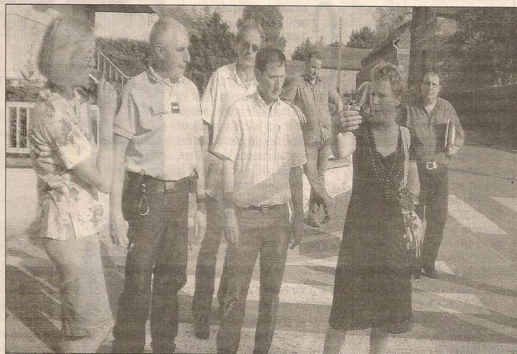
La conductrice du car (à droite) explique ses difficultés à manœuvrer.

Toutes les personnes présentes se sont accordées pour dire que le risque d'un accident grave n'était pas exclu. De nombreux exemples d'indiscipline sont cités. Très peu de parents d'élèves se sont déplacés pour les entendre. L'année scolaire s'est heureusement écoulée sans accident n'arrive. Pour la rentrée