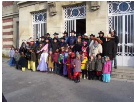
14h00 arrivée des premiers participants