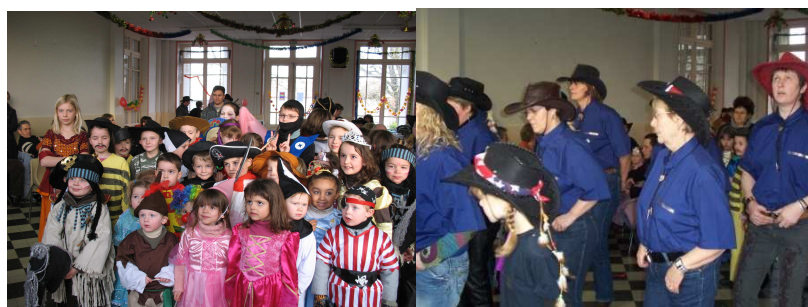
Partie de crêpes à la salle des fêtes de la mairie Et prestation du Country Club que nous remercions

Merci à tous, et rendez-vous à l'année prochaine