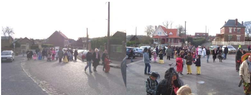
Défilé dans les rues de Vendeuil