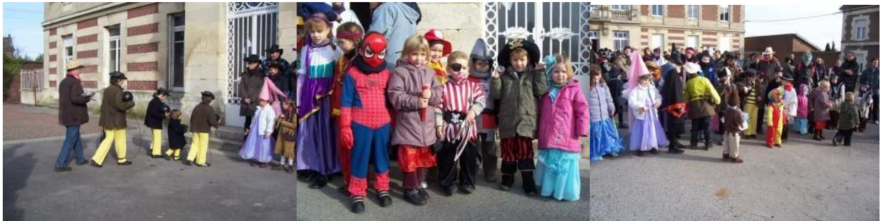
Tous les supers héros se joignent au défilé